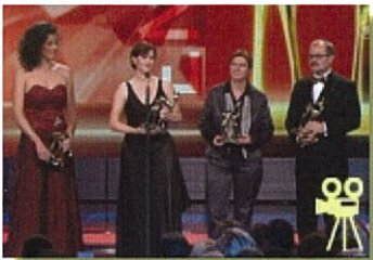
Videoausschnitt - Bambi 2008